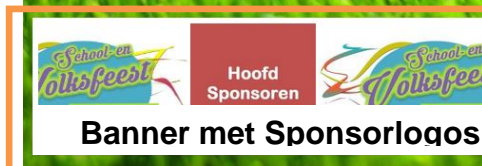
Banner met Sponsorlogos